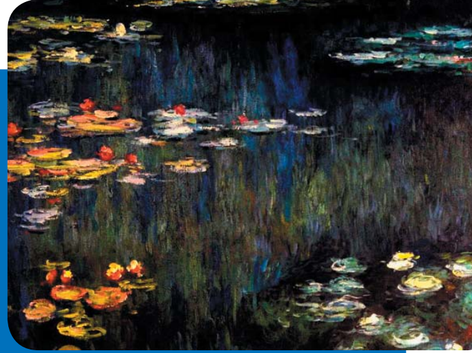
Claude Monet, Waterlilies, Green Reflection, Left Part, 1916 – 1923, Orangerie, Paris